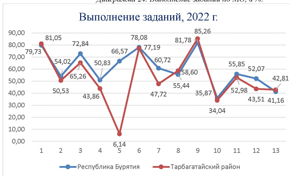
Диаграмма 24. Выполнение заданий по МО, в %.

• На данной диаграмме видно, что учащиеся муниципалитета при выполнении диагностической работы больше всего затруднились с заданием №5, где проверялось умение находить в тексте информацию, представленную в явном виде (предметная область - окружающий мир: умение ориентироваться на местности, определять стороны горизонта).