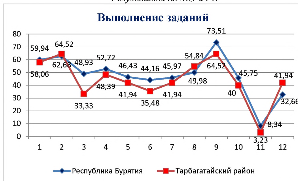
Результаты по МО и РБ

На данной диаграмме видно, что результаты выполнения диагностической работы учащимися муниципалитета в целом схожи с республиканскими значениями.